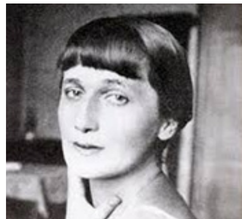
Ахматова Анна Андреевна (1889 — 1966)

В 1920-е годы вышли поэмы «Лирическое отступление», «Свердловская буря», стихи о русских революционерах. Многие его военные стихи и поэмы — страницы поэтической хроники Отечественной войны: «Радиосводки», «Полет пуль», «В последний час», «Пламя победы». В 1961 году книгой «Зачем и кому нужна поэзия» Асеев подводит итоги своего творчества и своей жизни. В 1963 поэт умер.