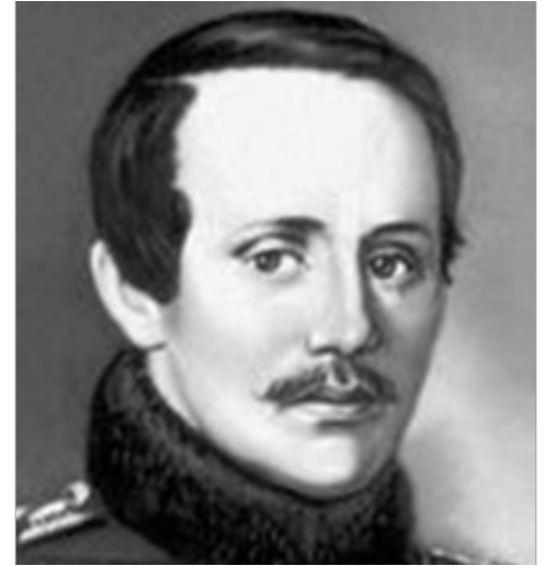
Лермонтов Михаил Юрьевич (1814 – 1841)

За период службы в театре Шекспир приобрел широкую известность и разбогател. Он стал совладельцем театра «Глобус», обзавелся недвижимостью в Лондоне и Стратфорд-он-Эйвоне. В 1613 году драматург перебрался в родной город, бросив и театр, и сочинительство. Последние три года его жизни прошли в кругу семьи. Он умер в 1616 году в день своего рождения.