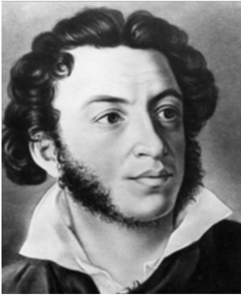
Пушкин Александр Сергеевич (1799 – 1837)

Родился в старинной дворянской семье. В 1811–1817 годах учился в Царскосельском лицее, где написал около 120 стихотворений. После окончания лицея жил в Петербурге, служил в Коллегии иностранных дел в чине коллежского секретаря. В 1818–1820 годах написал поэму «Руслан и Людмила». В 1820–1824 годах за написание политических стихов и эпиграмм находился в ссылке в Кичинево и Одессе, где им были созданы «Кавказский пленник», «Бахчисарайский фонтан» и т. д. В 1824 году был уволен со службы и отправлен в псковское имение отца. Здесь Пушкин работал над «Евгением Онегиным», написал поэмы «Цыганы», «Граф Нулин», драму «Борис Годунов».