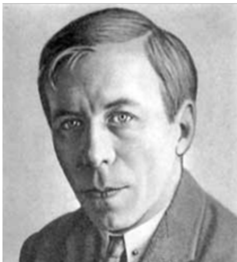
Асеев Николай Николаевич (1889 - 1963)

В 1859 году Никитин открыл книжный магазин с целью способствовать просвещению молодежи. Тяжелая жизнь, нужда, бесконечные хлопоты и огорчения, доставляемые отцом, впадшим с горя в запой, напряженные занятия поэзией в свободные от дел минуты — все это подорвало силы Никитина. Он умирает от чахотки.