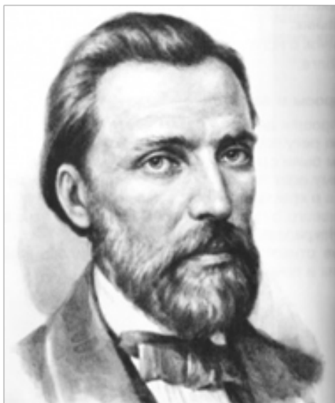
Никитин Иван Саввич (1824 – 1861)

Родился в Воронеже в семье купца и владельца небольшого воскобелительного завода. В восьмилетнем возрасте поступил в духовное училище, затем в Воронежскую семинарию, где у него пробудился интерес к литературе. Он зачитывался Жуковским, Пушкиным и Кольцовым, которые стали любимыми его поэтами.