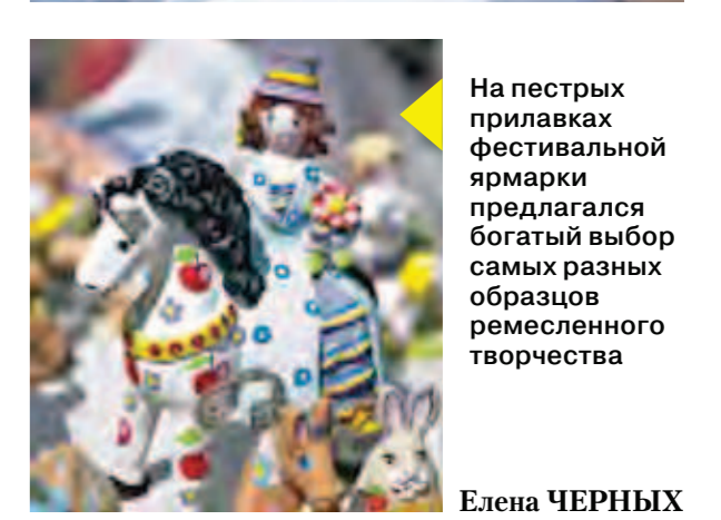
На пестрых прилавках фестивальной ярмарки предлагался богатый выбор самых разных образцов ремесленного творчества