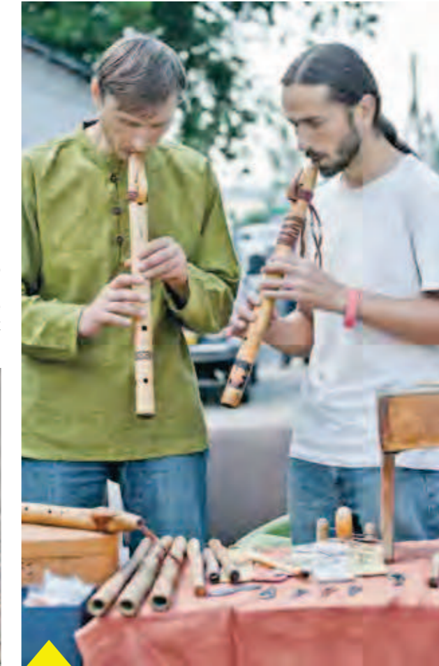
Не каждый день услышишь завораживающие звуки старинных народных инструментов!