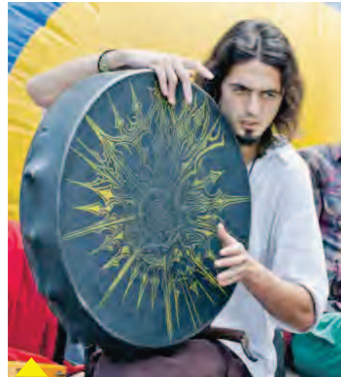
В фестивале приняли участие любители народного искусства из разных российских городов, представляющие как традиционный фольклор, так и современные направления этники: фолк-рок, транс-фолк, нео-фолк (авторскую музыку на основе древних традиций).

Думаете, для того, чтобы познакомиться с традициями разных народов, обязательно нужно ехать за тридевять земель? Те, кто побывал на фестивале «Этноград» в минувшие выходные, теперь так точно не считают. Еще бы, ведь в эти дни на фестивальных площадках можно было окунуться в атмосферу Индии, Африки, Скандинавии, проникнуться колоритом культуры североамериканских индейцев и вспомнить свои славянские корни! И все это в полчасе езды от центра города – в Доме культуры «Придонской» и на территории близлежащего скверика.