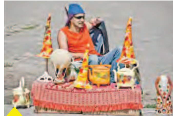
Чем не «филиал» восточного базарчика?