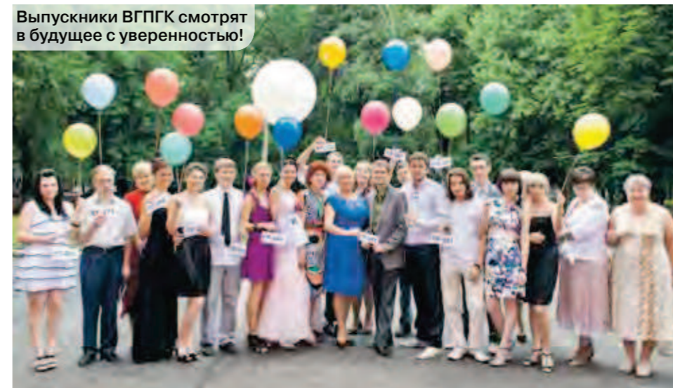
Выпускники ВГПГК смотрят в будущее с уверенностью!

Воронежский государственный промышленно-гуманитарный колледж можно смело назвать кузницей кадров. Работая в духе времени, учебное заведение старается поддерживать только перспективные направления, а значит, его выпускники востребованы на рынке труда. 30 июня здесь состоялся традиционный выпускной. В этом году специалистами стали 433 студента. Многие из них получили дипломы с отличием.