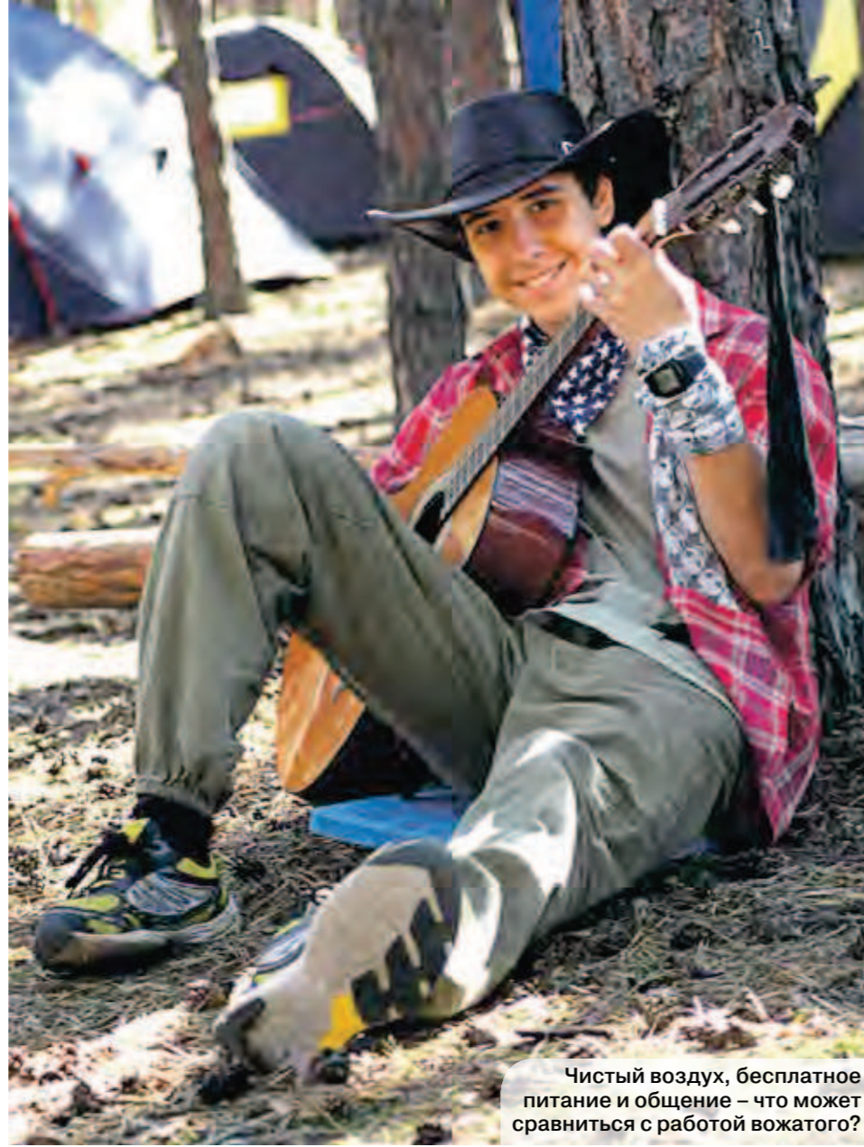
Чистый воздух, бесплатное питание и общение – что может сравниться с работой вожатого?

Студенты же – народ более разборчивый и стремящийся трудоустроиться, так сказать, «на постоянку», а потому выбирающий вакансию, соответствующую будущему диплому. Впрочем, моя роль не такая: я решила примерить на себя образ первокурсницы и, купив